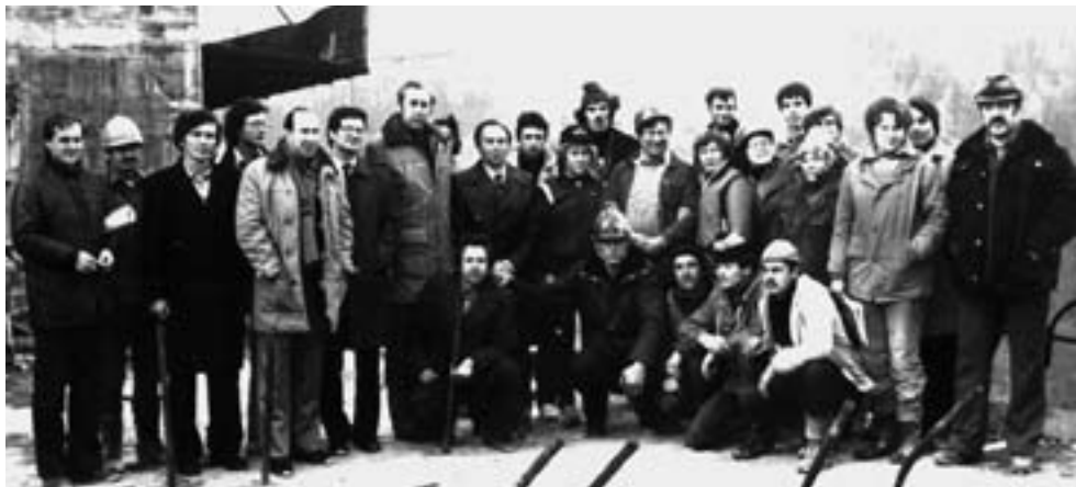
Сборная команда СССР по лыжным гонкам на строительстве Саяно-Шушенской ГЭС. 1983 г.

манды по лыжным гонкам, двоеборью и биатлону свой тренировочный сбор в Красноярском крае регулярно завершали встречей на Саяно-Шушенской ГЭС, где подводили итоги прошедшего спортивного сезона и ставили задачи на предстоящий.