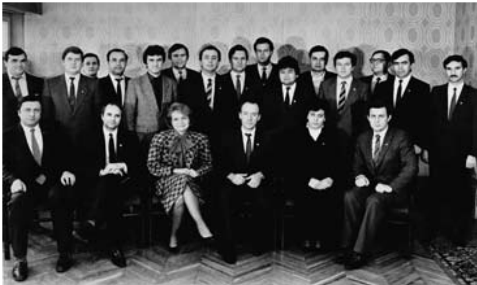
Секретари ЦК ВЛКСМ и секретари ЦК ЛКСМ союзных республик

с помощью подкрепления из ОМОНа и милиции, основных зачинщиков стали арестовывать.