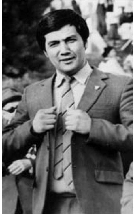
Как молоды мы были! 1982 г.