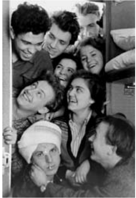
В дороге на первую целину