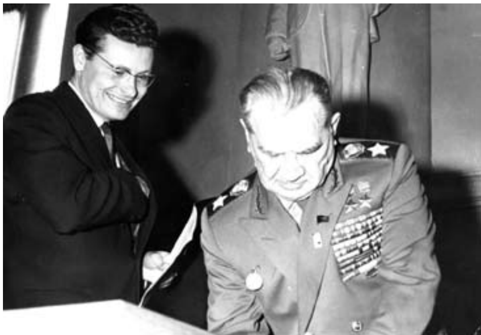
П.К. Лучинский с маршалом В.И. Чуйковым. 1966 г.

мента и президентом Республики Молдова. Среди моих друзей, с кем я до сих пор общаюсь, процентов семьдесят — это те люди, с которыми я познакомился в годы работы в комсомоле.