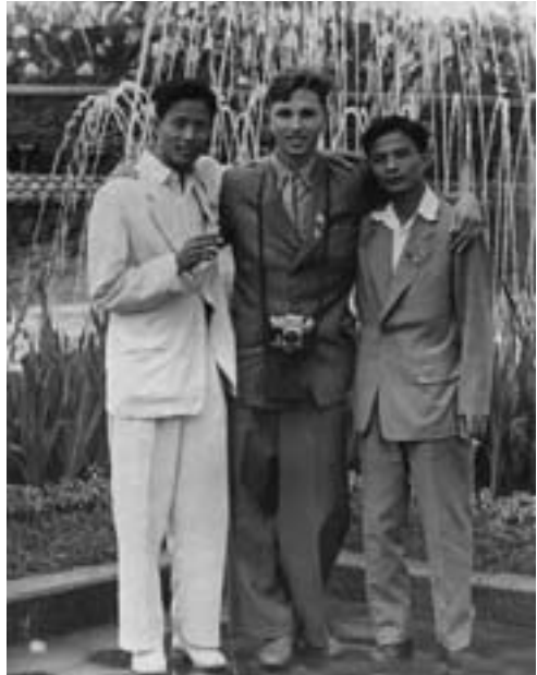
Участники VI Всемирного фестиваля молодежи и студентов в Москве. 1957 г.

Огромную роль сыграла премия Ленинского комсомола в области науки. По деньгам это было не так уж много — 2 тысячи рублей, но если учесть, что аспирантская стипендия была около 100 рублей, то это, считай, 20 аспирантских стипендий, то есть полтора года молодой ученый имел дополнительное финансирование. Но главное в другом. Был четкий отбор. В Комиссии по премиям работали видные ученые. Первый ее состав возглавлял академик Н.Г. Басов, нобелевский лауреат. В состав комиссии входили академики А.П. Александров, Р.З. Сагдеев, С.П. Новиков, А.И. Целиков и многие другие. На последнем этапе существования СССР возглавлять комиссию было поручено мне. Премия Ленинского комсомола имела большое значение в том смысле, что вы-