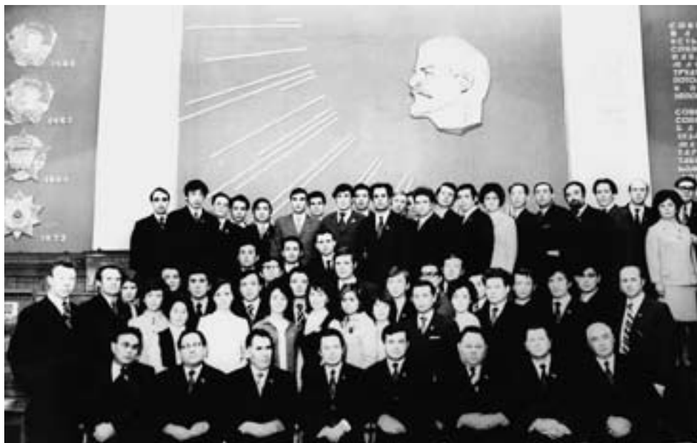
Делегаты 30-й областной комсомольской конференции

сии реального сектора экономики в России можно сегодня вести речь? Она в мире — рукотворная, а в России — виртуальная.