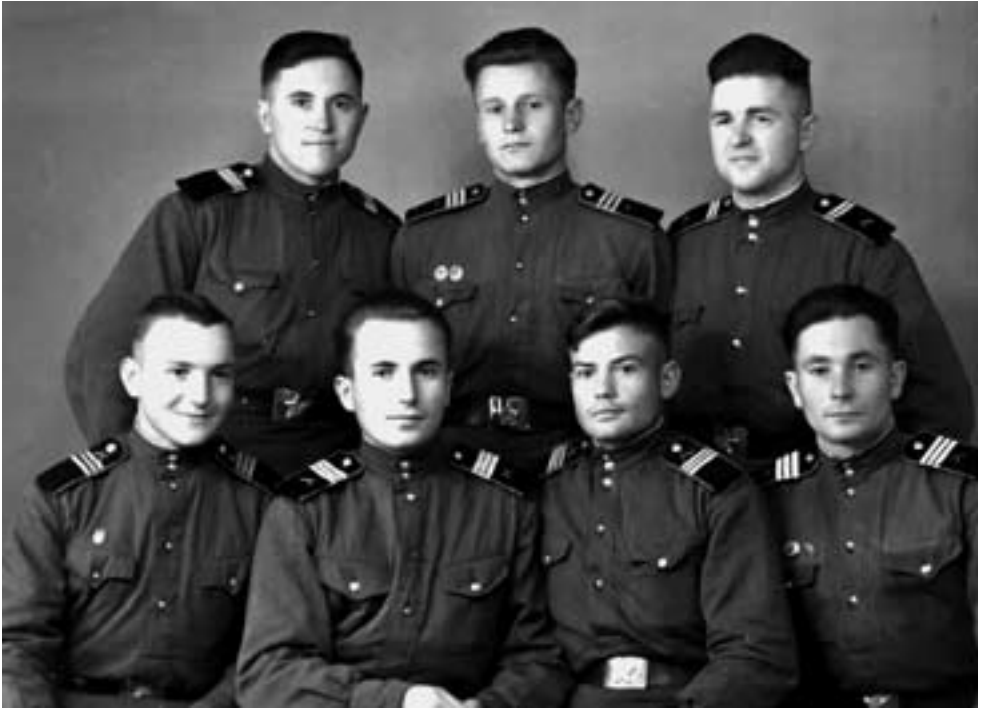
Курсанты полковой школы. 1956 г.