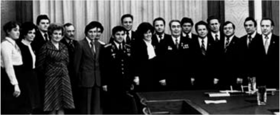
Л.И. Брежнев с секретарями и членами ЦК ВЛКСМ

отделений АН СССР, уникального медицинского центра академика Илизарова в Кургане, единственного в мире Детского музыкального театра Наталии Сац в Москве. А советское студенчество на века оставило рукотворный памятник первому космонавту — город Гагарин.