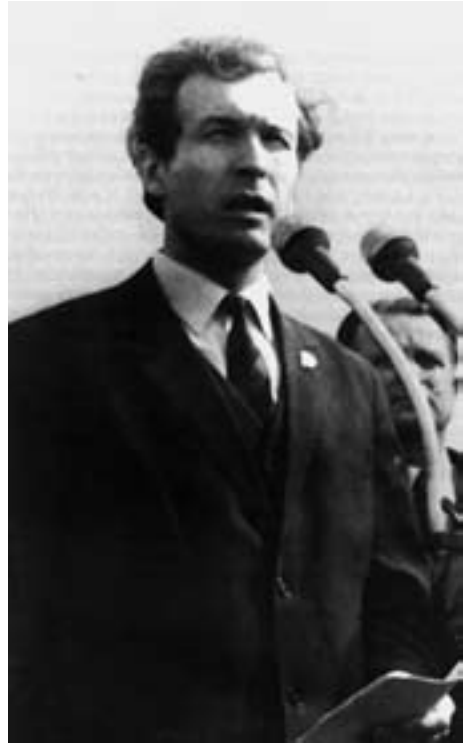
Первый секретарь Советского РК ВЛКСМ

Замечу: сегодня БАМ работает на полную мощность, превышающую проектную, и значение магистрали с каждым днем возрастает. Поэтому, что бы ни писали и ни говорили, факт остается фактом: большое, нужное для народа дело сделала молодежь. На БАМе выросло целое поколение, и — не сомневайтесь — не самое плохое поколение! И наш БАМ верой и правдой служит и будет служить России.