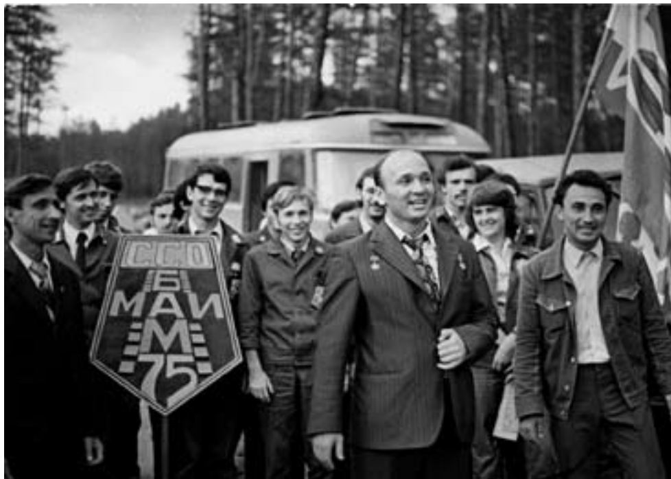
Приезд отряда МАИ на БАМ

Первый раз прилетел на БАМ по поручению ЦК комсомола в январе 1975 года. Вокруг тайга, безлюдные места. Первые десанты бамовцев по 25 человек были разбросаны вдоль трассы. Они стали основой строительства будущих стационарных поселков — Звездного, Кунермы, Кувукты и других.