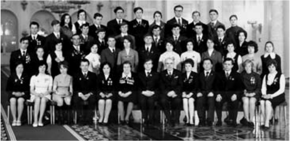
Делегация Алтайского края на XVII съезде ВЛКСМ

гала молодым людям почувствовать самостоятельность, научиться жить и работать в коллективе и вообще определиться в жизни, стать успешными организаторами производства. Что касается студенческого строительного отряда города Гагарина, я считаю, что он был гордостью Ленинского комсомола, студенческих отрядов. Студенты постоянно встречались с приезжающими туда космонавтами, родственниками Юрия Алексеевича Гагарина, его мамой Анной Тимофеевной, замечательным, добрым и милым человеком. Студенты внесли свой вклад в создание музея первого космонавта и в целом космонавтики. Я много раз был в студенческих отрядах в городе Гагарине, как-то и всей семьей выезжал, для того чтобы принять участие в дне ударного труда. Посадили деревья в парке. Было сделано многое, чтобы город Гагарин рос, хорошел, развивался.