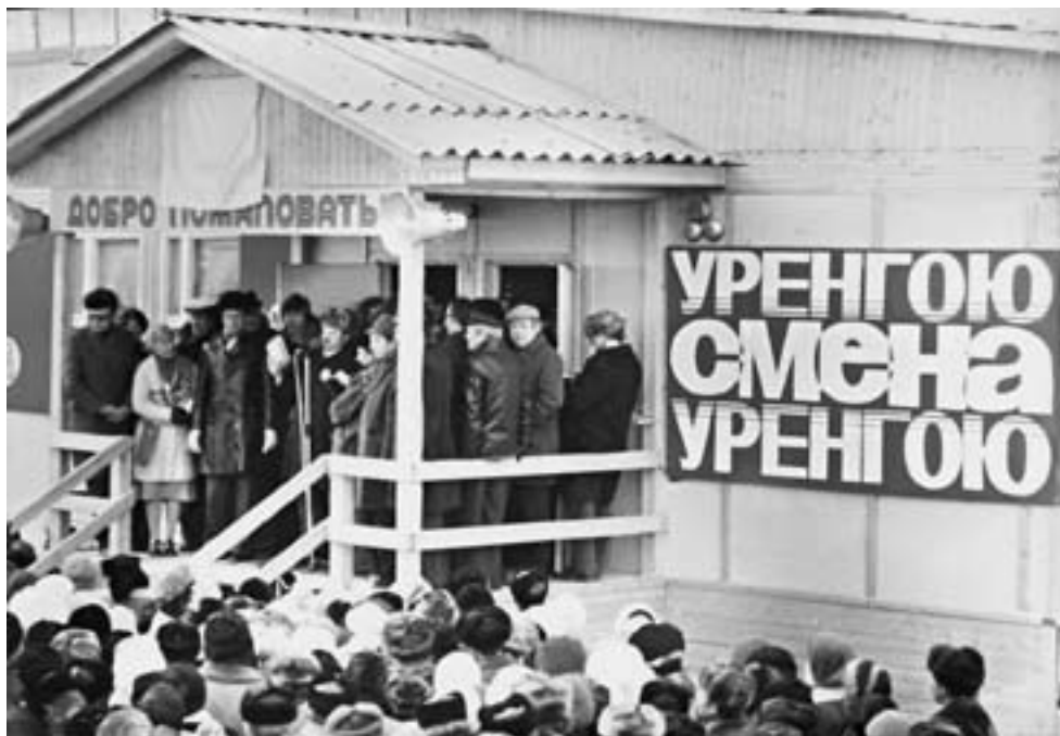
Открытие Центральной городской библиотеки имени журнала «Смена» в Новом Уренгое

А еще мы много читали. Не буду здесь говорить об этом, потому что в результате этого и сам стал писателем. Но книги с высокими духовными установками в скрепе со спортом сформировали грамотное и деятельное послевоенное поколение, на которое немало чего легло.