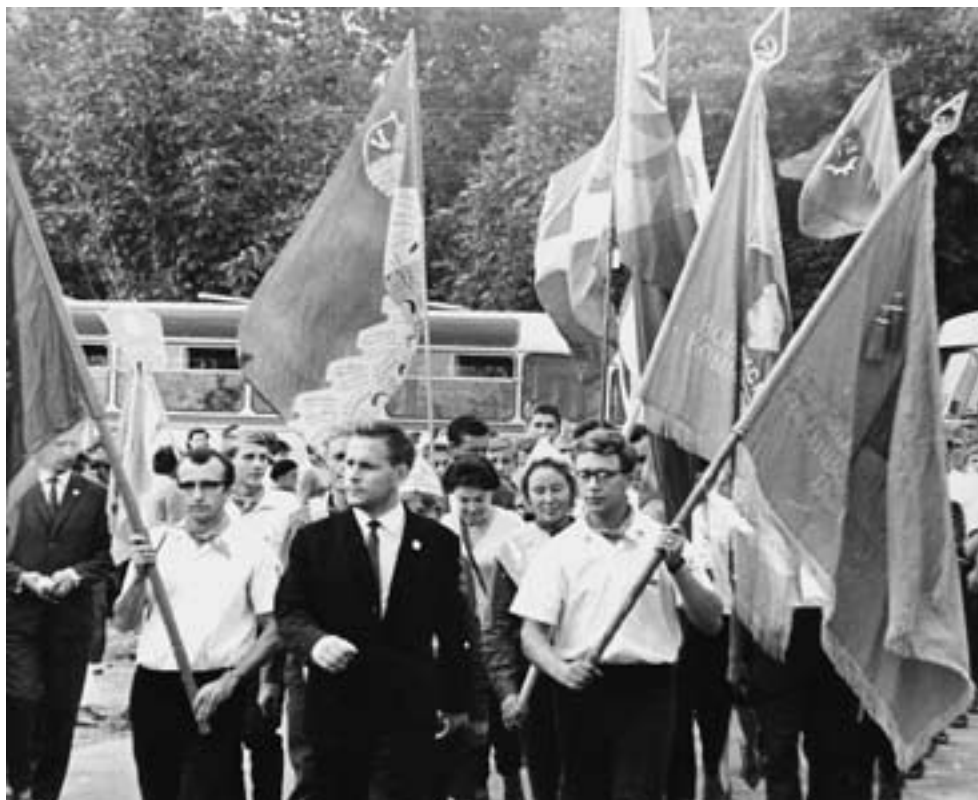
Слет участников похода по местам боевой славы Рязанской области. Июнь 1962 г.

Но главное — такие нравственно-этические понятия, как любовь к Родине, патриотизм, мужество, добро, справедливость, великодушие, не употреблялись мимоходом, формально, для красного словца.