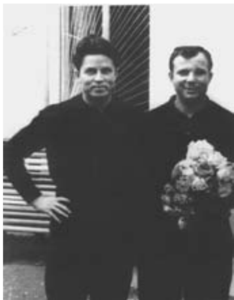
С Юрием Гагариным