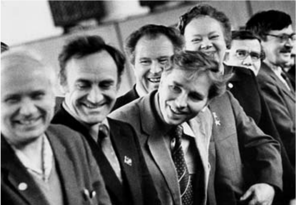
Чествование новых членов Академии наук СССР. Томск, 1984 г.

лучать, но это тот случай, когда человек стремится к высшему, ему открывается научная истина, он уже в плену у нее. Спустя время у него и деньги пойдут, и международные поездки, международное признание появится и так далее — человек оказывается на соответствующем уровне в соответствующей шкале ценностей. Вечные ценности при любой системе — монархической, капиталистической, социалистической — ими и остаются. Но жизнь, безусловно, стала сложнее. Работать, пробиться ученым трудно.