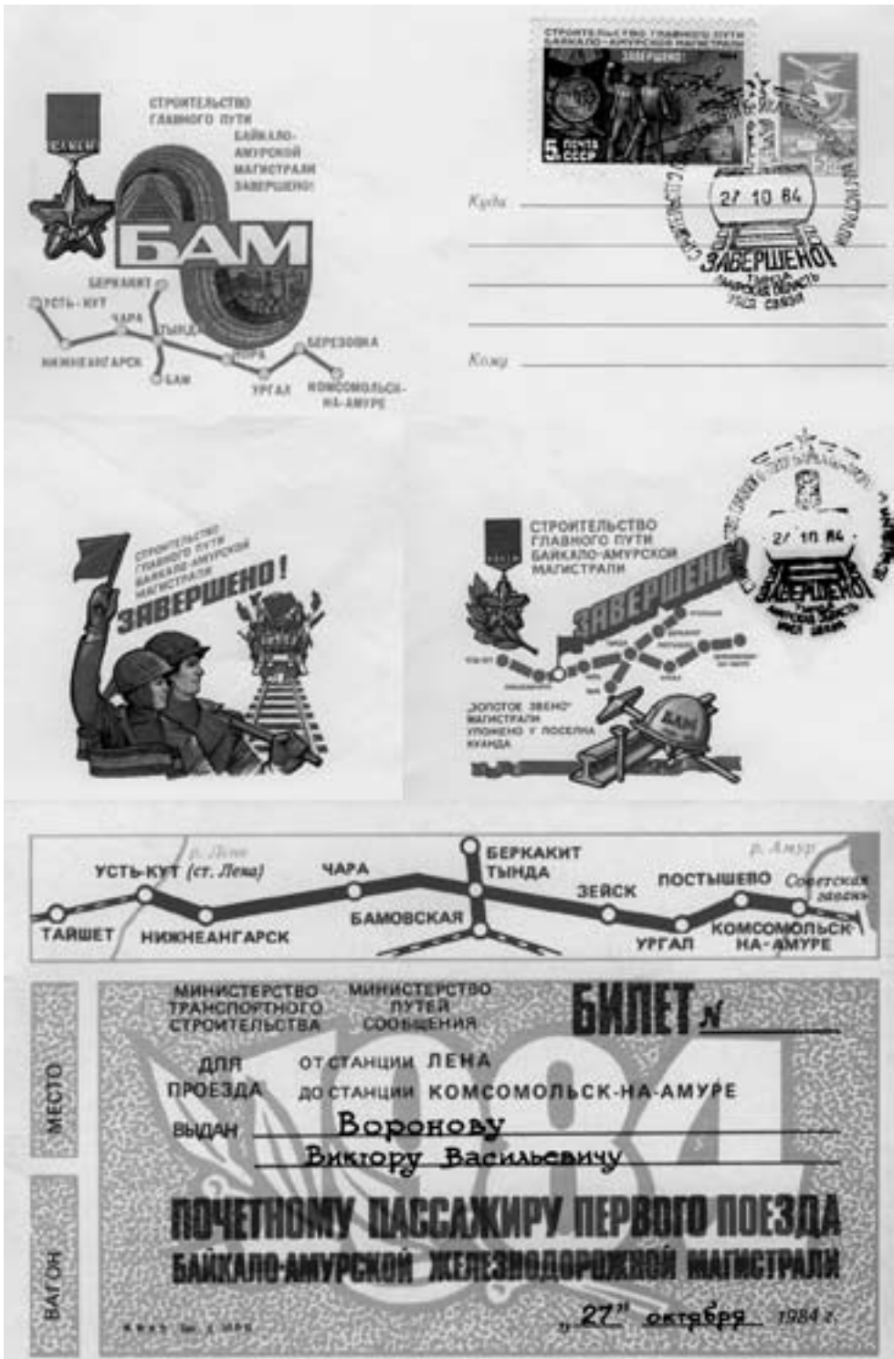
Дорогие бамовские реликвии