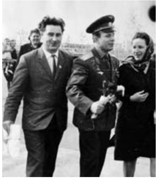
А.С. Канто с Ю.А. Гагариным

Не побоюсь утверждать, что все названные вопросы отражают базовые ценности для молодежного движения: о зависимости политики от источников ее финансирования, о ее (политики) чистоте и меркантильной непорочности, о сочетании молодежного максимализма и критицизма со способностью и готовностью молодежи лично, самой решать свои собственные проблемы. И кто возразит, что эти вопросы не имеют отношения к современной подрастающей политической смене?