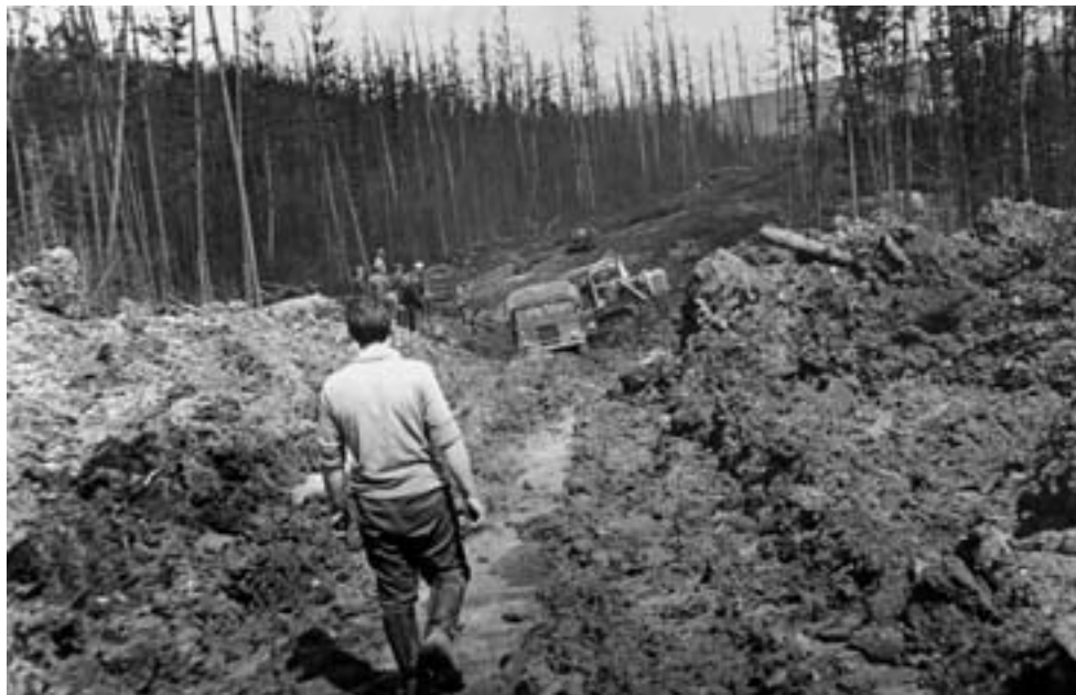
Прокладка притрассовой дороги

строители, солдаты и пассажиры с поезда. Я долго отвечал на все интересующие их вопросы.