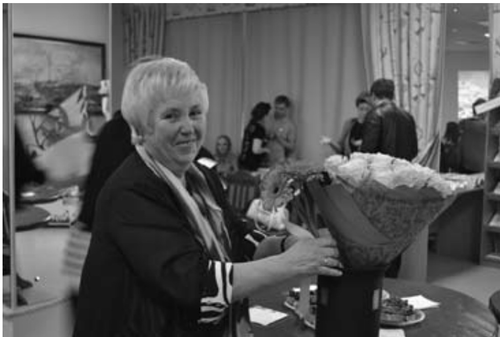
На юбилее Педмастерской гуманитарного факультета. 2017 г.