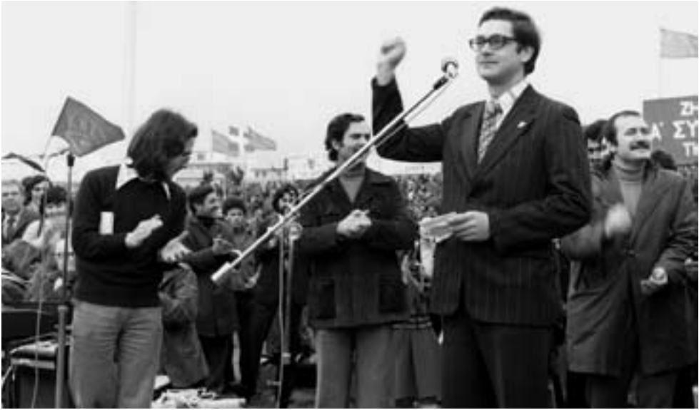
Выступление руководителя делегации советской молодежи В.С. Посохина на митинге в честь Первого съезда комсомола Греции. Афины, 1976 г.

числять все яркие события того времени, то надо писать отдельную книгу. Съезды комсомола Молдавии, празднование памятных дат в республиканском молодежном движении, различные — большие и малые, местные и все-союзные — мероприятия. К примеру, Первый фестиваль советско-кубинской дружбы, проведенный в республике, когда буквально все поколения людей принимали в нем участие. Целую неделю юноши и девушки двух стран пели и танцевали в Кишиневе, других городах и поселках, смеялись и плакали от радости. Незабываемый праздник, который остался навсегда в сердце каждого участника этого, без преувеличения, грандиозного события.