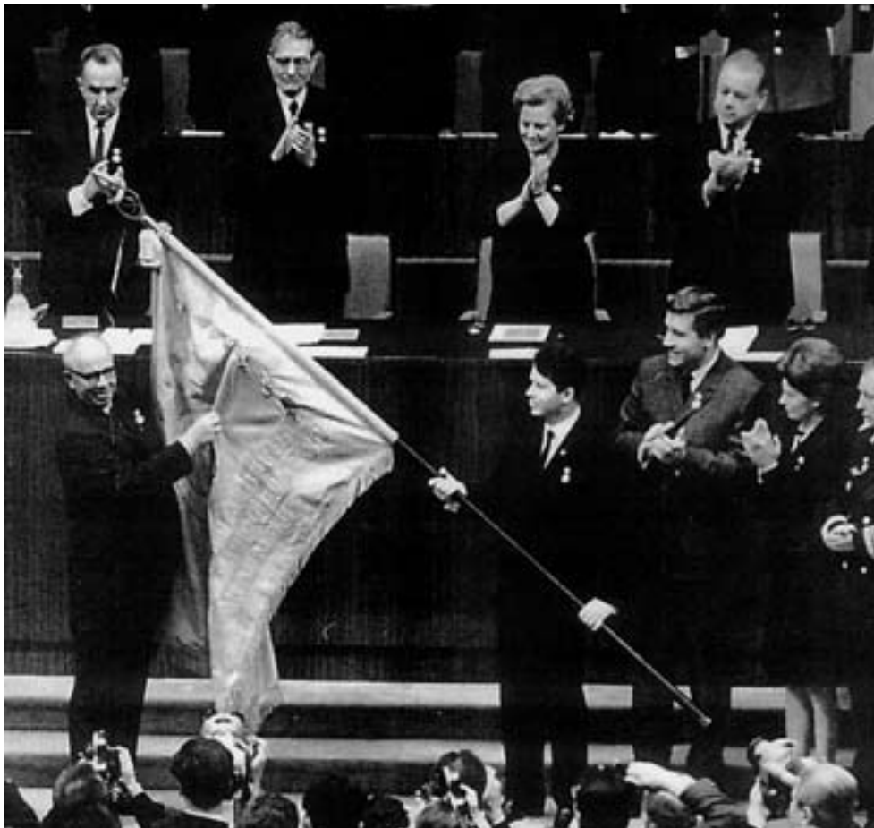
ВЛКСМ вручён орден Октябрьской Революции