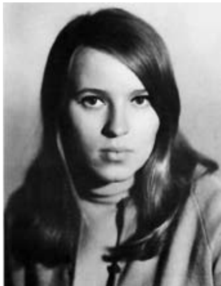
Валентина Матвиенко в студенческие годы

О том, что в институтские годы Валентина Матвиенко была яркой, неординарной девушкой, лидером, заводилой, вспоминают многие, кто учился с ней. Об этом свидетельствует и характеристика тех лет на студентку Тюнину Валенти-