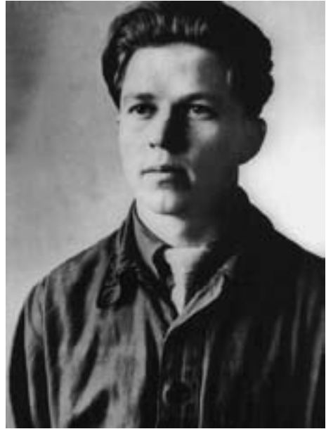
Секретарь комитета ВЛКСМ пединститута