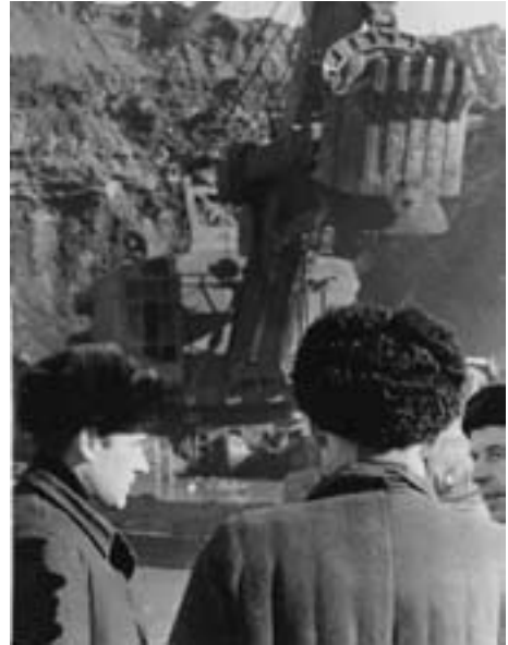
На ударной комсомольской стройке — Курской магнитной аномалии

ставками материалов и оборудования решали оперативно на месте сами, связываясь с комсомольскими штабами и контрольными группами, а иногда и с помощью обкомов комсомола.