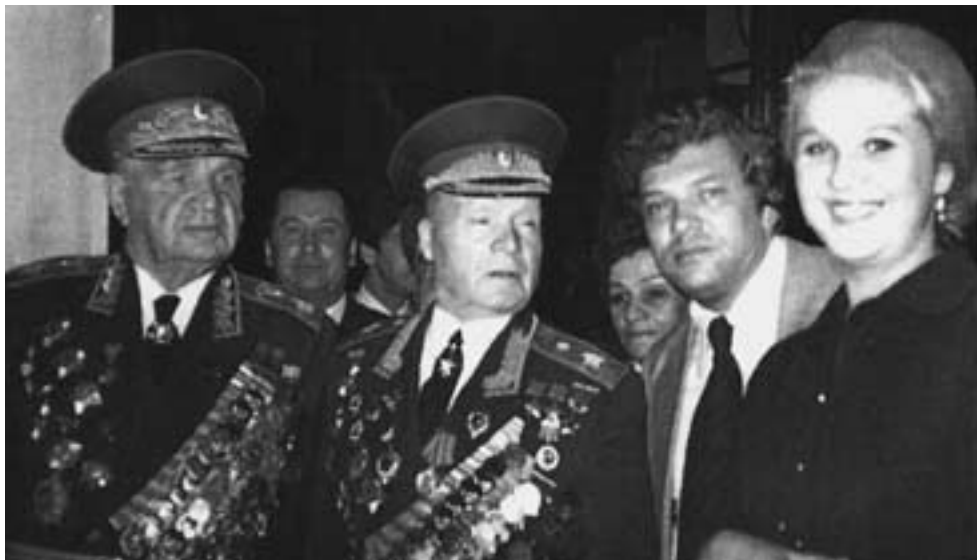
С прославленными полководцами В.И. Чуйковым, Д.Д. Лелюшенко и В.В. Сухорудо

нерального прогона сидим в тоске, подходит Сухорудо и говорит, что все гениально, потому что мы, пожертвовав этим блоком, сохранили главное. Он, оказывается, был готов к этому и предвидел данное решение комиссии. Для нас всех это было уроком на будущее — уметь отказываться от чего-то ради возможности высказаться и решить главное (кстати, в будущем мне эта наука здорово пригодилась).