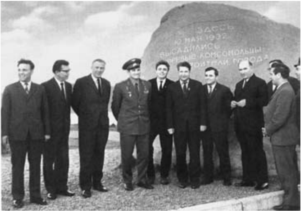
Первый секретарь ЦК ВЛКСМ Борис Пастухов в Комсомольске-на-Амуре у памятного камня

— Адресуйте этот вопрос к советской власти, к ЦК КПСС (это они учредили День молодежи), — отвечаю я и обращаюсь к Нетто: — Игорь, вот ты любишь собирать пластинки, в отличие от своего товарища по сборной Льва Яшина, который коллекционирует галстуки. Нам известно, что из каждой поездки за рубеж ты привозишь уникальные пластинки. Но имей в виду: никакой помощи от райкома, никаких характеристик вам не будет, если вы сорвете нам праздник. Думайте, размышляйте, дорогие друзья!