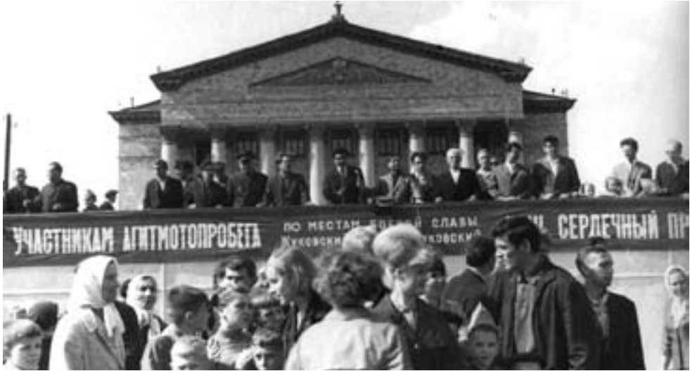
Встреча участников агитмотопробега ЛИИ Жуковский—Брест— Жуковский в честь 23-й годовщины Победы в Великой Отечественной войне

было оказано доверие работать инструктором, а потом в Аппарате Президента СССР в должности заместителя заведующего отделом. При этом во время работы в Аппарате Президента СССР, опираясь на опыт партийной и комсомольской работы, удалось внести определенный вклад в государственное строительство.