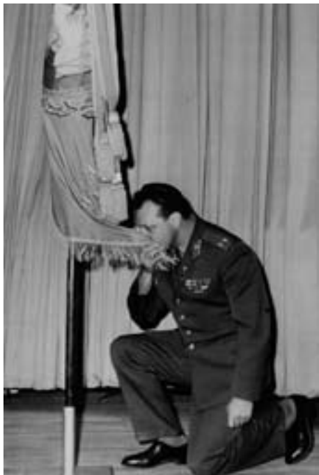
Прощание с комсомолом

с комсомолом по армейским традициям. Так я и сделал. Сказал несколько благодарственных слов, попросил у пленума разрешения попрощаться по-армейски, подошел к комсомольскому Знамени, преклонил колено перед ним, поцеловал край полотнища и встал по стойке «смирно».