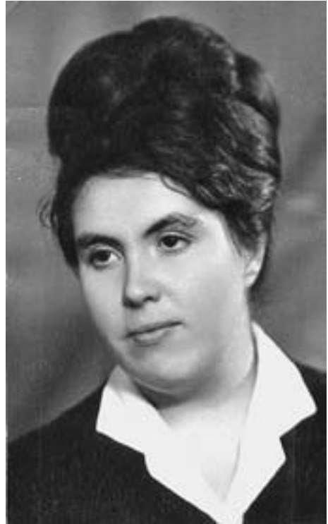
Комсомольский секретарь. Начало 1970-х гг.

Такое же понимание я встретила в новой школе, куда с сентября 1967 года райком партии направил меня на новую должность: организатора внеклассной и внешкольной воспитательной работы — заместителя директора школы. В школе было более 1600 учащихся. Подготовка к полувековым юбилеям