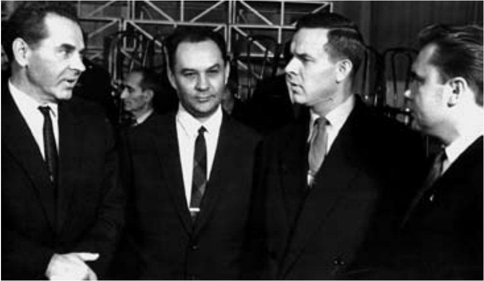
Первые секретари ЦК ВЛКСМ в 1967—1968 гг. Н.А. Михайлов, А.Н. Шелепин, В.Е. Семичастный, С.П. Павлов

На определенном этапе экономика страны стала расти больше количественно, нежели качественно. Остро встали вопросы повышения производительности труда, внедрения достижений науки и техники.