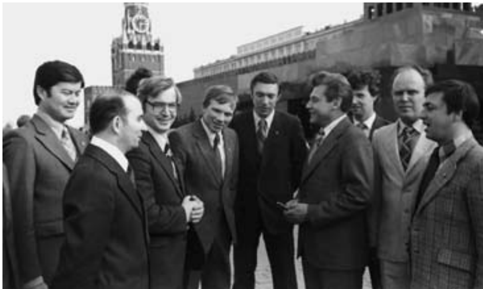
Сектор Центрального и Волго-Вятского региона ЦК ВЛКСМ на Красной площади. 1980 г.