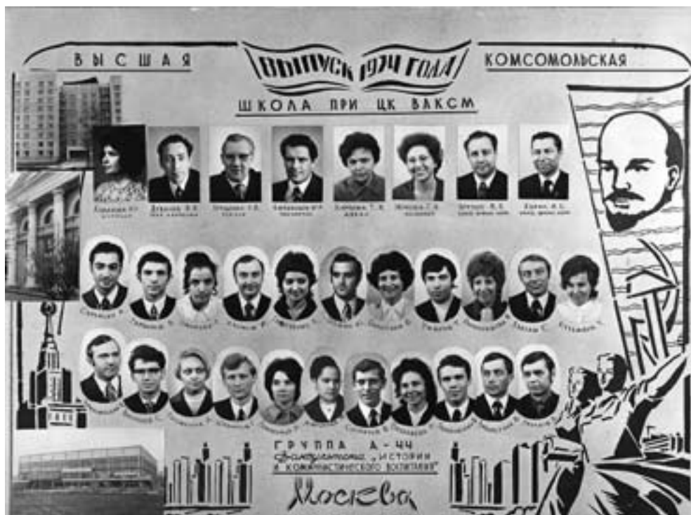
Выпускники 1974 г. ВКШ при ЦК ВЛКСМ