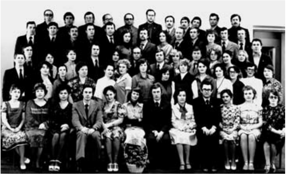
Аппарат Пермского ОК ВЛКСМ