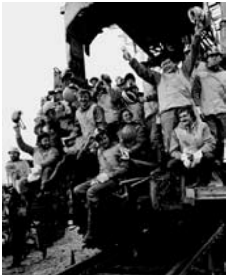
Есть стыковка БАМа

...Комсомол, БАМ, Иркутск, Байкал, Чита, Чара, Тында, Усть-Кут, Таюра, Магистральный, Ния, Кунерма, Нижнеангарск, Беркамит, Кувыкта, Ургал... — это бесконечный ряд слов-паролей, на которые мгновенно откликаются серебряные струны наших душ и сердец.