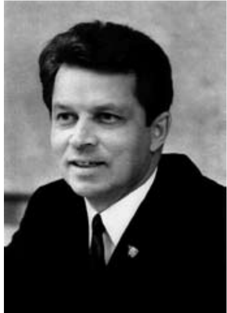
Первый секретарь ЦК ВЛКСМ

В декабре 1952 года был на совещании секретарей ЦК ЛКСМ республик, крайкомов и обкомов, обсуждавшем задачи комсомола по выполнению решений XIX съезда КПСС. Его открыл А.Н. Шелепин, избранный 16 октября членом ЦК партии, а 30 октября — первым секретарем ЦК ВЛКСМ (Н.А. Михайлов стал членом Президиума, секретарем ЦК КПСС). Александр Николаевич кратко, но ярко и четко сформулировал практические задачи комсомола по выполнению