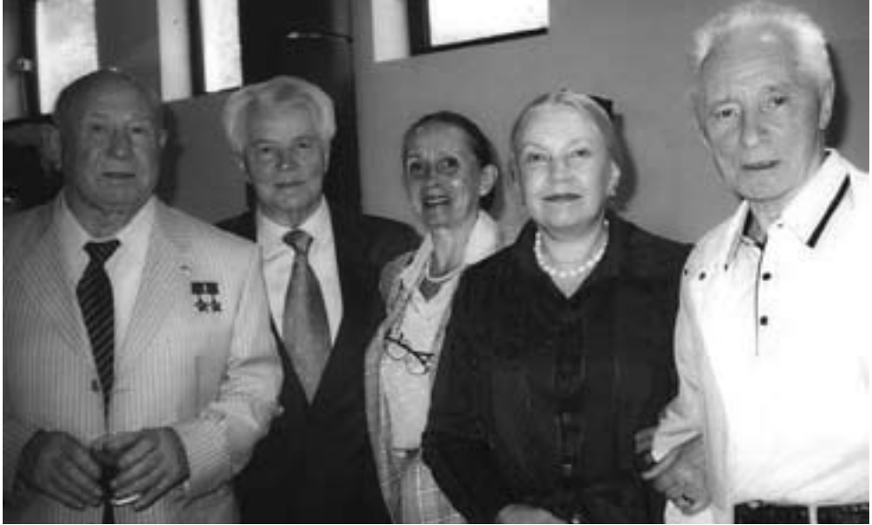
С Юрием Григоровичем, Наталией Бессмертной и Алексеем Леоновым

результатов в развитии физкультурно-массовой работы среди комсомольцев и молодежи, пионеров и школьников.